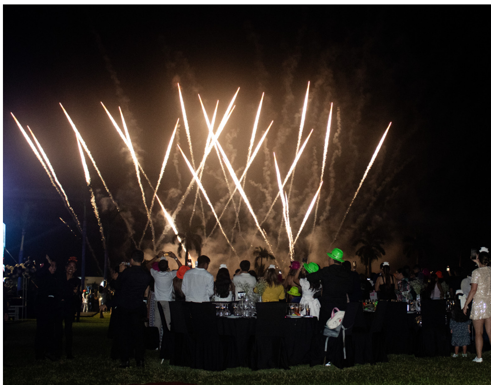
Fiesta de año nuevo 2025, Palacio Mundo Imperial

es un oasis turístico en la Riviera Diamante de Acapulco, un lugar con posibilidades ilimitadas: aquí lo tienes todo, incluyendo las fiestas más extraordinarias de la zona. Con instalaciones de primer nivel, servicio de clase mundial, una oferta gastronómica única y entretenimiento de calidad, nuestras celebraciones son verdaderamente memorables.